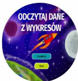
ODCZYTAJ DANE Z WYKRESÓW